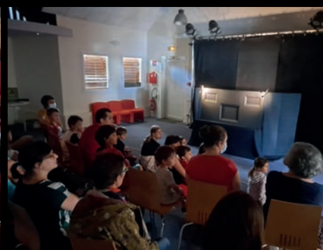
Bibliothèque de La Ferté-Saint-Aubin