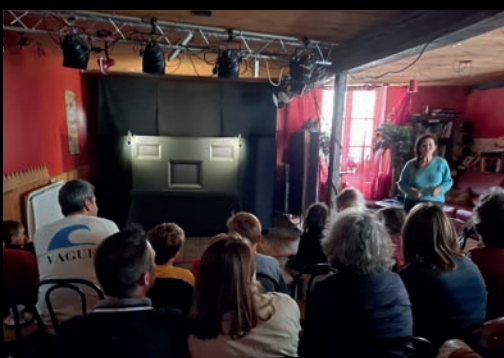
Café culturel de Laillly-en-Val