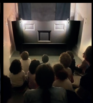
École Montessori inclusive, Le renard et la rose